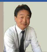
プラントデザイン

専門分野は建築設計・空間デザイン。協議会副会長の立場から、建築デザインのコンセプトをまとめ、事業者選定、デザイン設計監修で、協議会での議論の成果を実際の施設設計に反映。